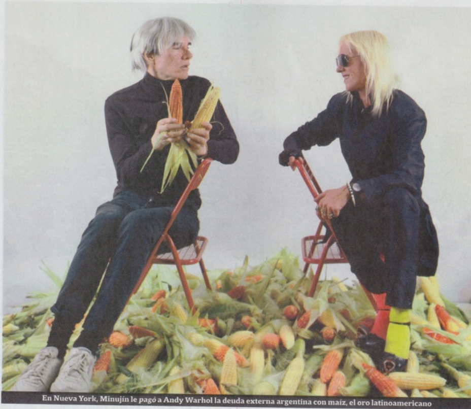
En Nueva York, Minujin le pagó a Andy Warhol la deuda externa argentina con maíz, el oro latinoamericano

pero Marta ya se había ganado un lugar en la meca del arte: la muestra tampoco había pasado desapercibida para Andy Warhol, el rey del Pop, que asistió a la inauguración.