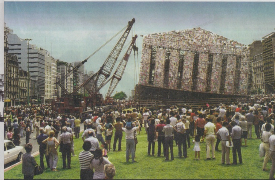
En 1983, para celebrar la vuelta de la democracia, expuso en la 9 de Julio su primer Partenón de libros prohibidos

mostrar que "todo cambia según el punto de vista con que ves las cosas".